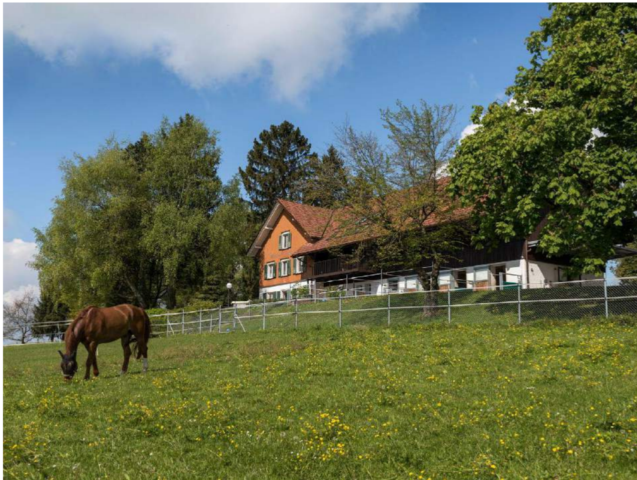
Rossrüti ist, was der Name verheisst: ein Paradies für Ross und Reiter. Auf dem höchsten Punkt: die «Waldrose».