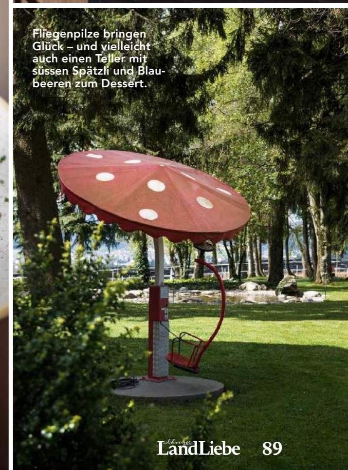
Fliegenpilze bringen Glück – und vielleicht auch einen Teller mit süssen Spätzli und Blaubeeren zum Dessert.