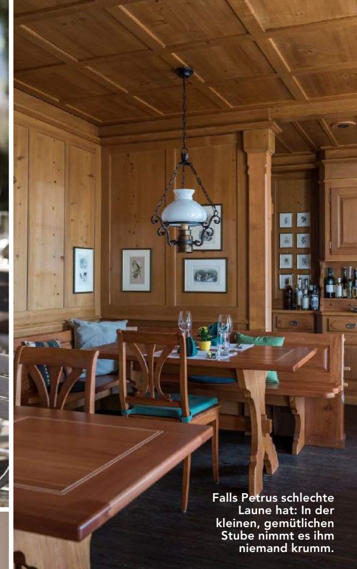
Falls Petrus schlechte Laune hat: In der kleinen, gemütlichen Stube nimmt es ihm niemand krumm.