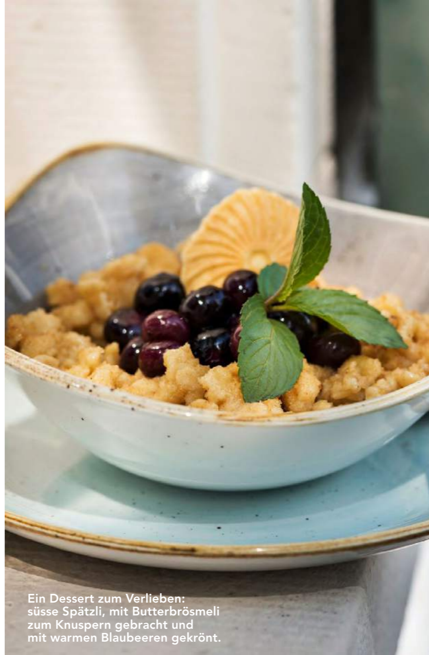
Ein Dessert zum Verlieben: süsse Spätzli, mit Butterbrösmeli zum Knuspern gebracht und mit warmen Blaubeeren gekrönt.

vergnügen beschern, bevor der Teig auf der Zunge zergeht. Wir sind hin und weg, geniessen das süsse Finale am begehrtesten Platz auf der Terrasse: an Tisch 13, einem Separee unter schattenspendenden Birken. Für Pärchen der Tisch der Tische. Aber nur, wenn sie nicht mehr so verliebt sind, dass sie sich ununterbrochen in die Augen schauen müssen. Wäre nämlich schade um die wunderbare Aussicht, die man von dort geniess. An klaren Tagen sind der Säntis und seine Gschpännli so nah und kitschig schön wie die Kulisse in einem Heimattheater. Grillen zirpen, Pferde wiehern – «ein Paradies», kommt einem unweigerlich in den Sinn. Besser noch: ein Paradies mit guter Küche. ✨