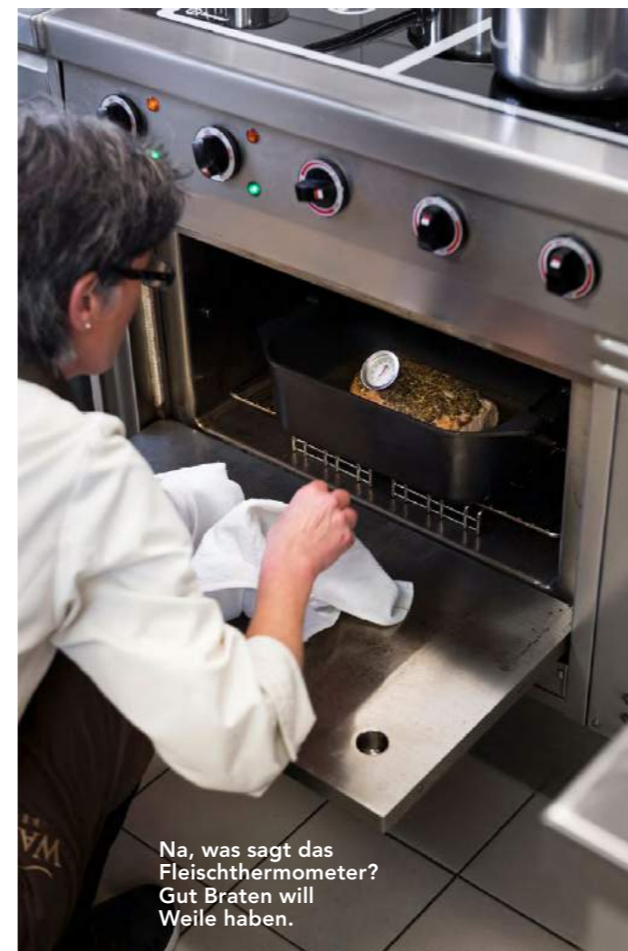
Na, was sagt das Fleischthermometer? Gut Braten will Weile haben.