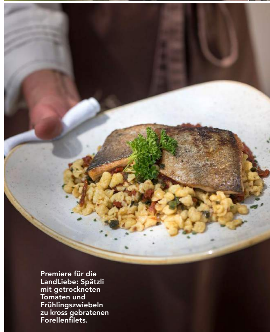
Premiere für die LandLiebe: Spätzli mit getrockneten Tomaten und Frühlingszwiebeln zu kross gebratenen Forellenfilets.