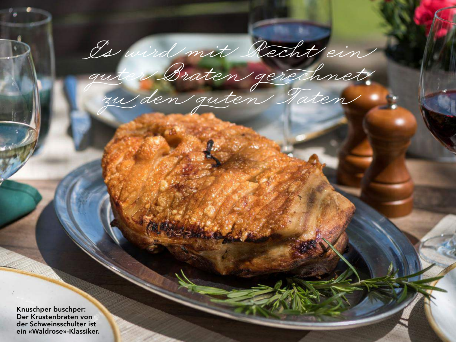
Knuscher buschper: Der Krustenbraten von der Schweinsschulter ist ein «Waldrose»-Klassiker.

Es wird mit Recht ein guter Braten gerechnet zu den guten Taten