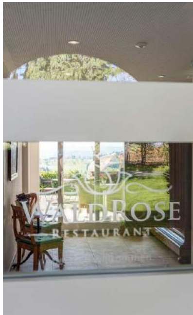
Durchsicht mit Aussicht: Eingang zum Restaurant Waldrose.

vergnügen beschern, bevor der Teig auf der Zunge zergeht. Wir sind hin und weg, geniessen das süsse Finale am begehrtesten Platz auf der Terrasse: an Tisch 13, einem Separee unter schattenspendenden Birken. Für Pärchen der Tisch der Tische. Aber nur, wenn sie nicht mehr so verliebt sind, dass sie sich ununterbrochen in die Augen schauen müssen. Wäre nämlich schade um die wunderbare Aussicht, die man von dort geniess. An klaren Tagen sind der Säntis und seine Gschpännli so nah und kitschig schön wie die Kulisse in einem Heimattheater. Grillen zirpen, Pferde wiehern – «ein Paradies», kommt einem unweigerlich in den Sinn. Besser noch: ein Paradies mit guter Küche. ✨